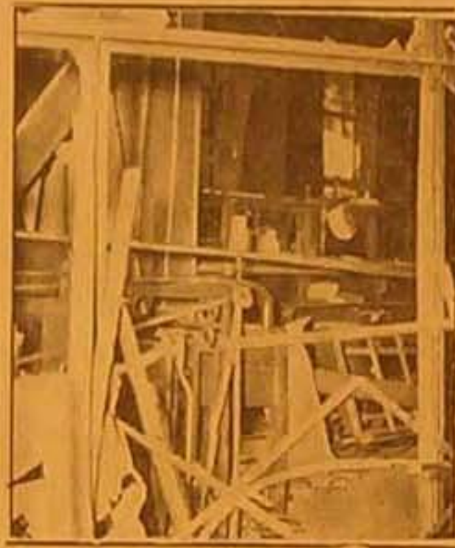
صورة التخراب الذي نتج عن اقتحام قذبة كانت موزعة في أحد الشوارع في شارع ولنتون في حي «الدويتش» في لندن