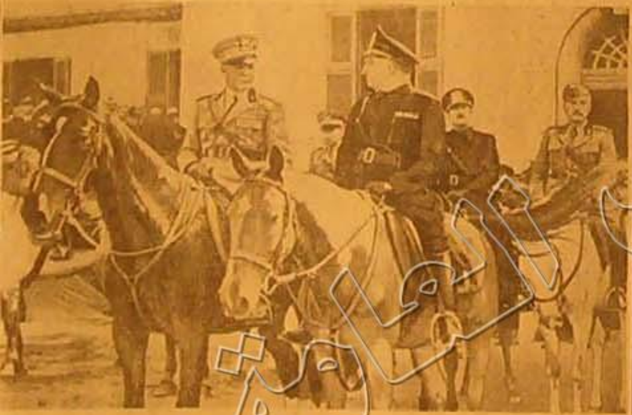
سافر لارشايل مادولفو في الأسبوع الماضي إلى ألمانيا فقام بمذكرة تفتيشية في البلاد التي غزتها القوات الإيطالية والصورة تمثل على صورة جواده (في اليسار) انما أحد الاستعراضات في تيرانا