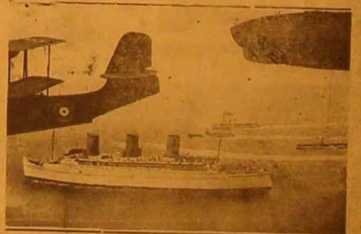
صورة أغلقت من الجو فاشارة الجبانة «اميرالورد» بريطانيا التي اقلت ملكي الانكلي في عودتها من رحلتها الى العالم الجديد بعد وصولها الى ميناء هاوغيون