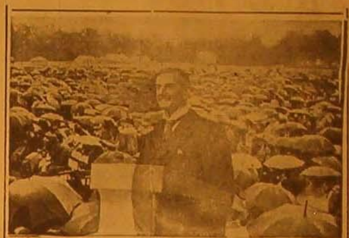
إلى آخره برايد رئيس الوزراء البريطانية في الأسبوع الماضي خطبة سياسية في مدينة كارديف أكد فيه مزعم بريطانيا على مقاومة الاعتداء ويرى في الصورة وهو يلقي خطبته على جمهور من خمسة ملايين باسقة انهباء المطر