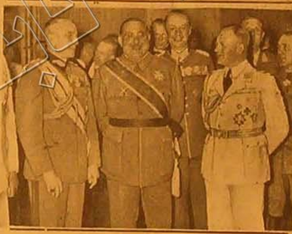
وصل الجنرال أرناندو أحد ضباط أركان الحرب في إسبانيا إلى برلين في الأسبوع الماضي وقام بمحادثات مع ضباط أركان الحرب الألمانية والصورة تمثل أثناء حفلة أظفها له الجنرال براوخس القائد العام للجيش الألمانية