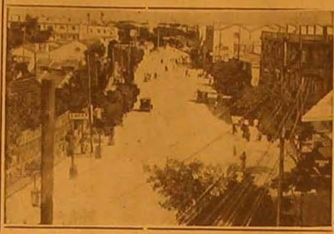
قامت القوات اليابانية بحملات تفتيش واسعة النطاق وحاصرت المناطق الأجنبية في مدينة هوانغ في شمال الصين والصورة تمثل أحد شوارع تلك المدينة