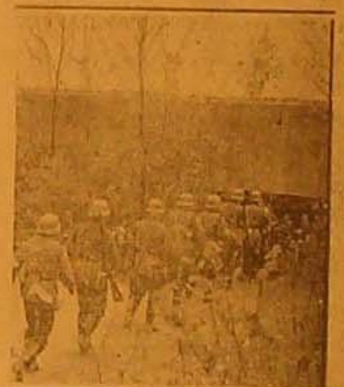
بعض الجنود الألمان في طريقهم إلى الاستحكامات على الحدود الغربية في وسط سحقريل انما للتاورات الأخيرة