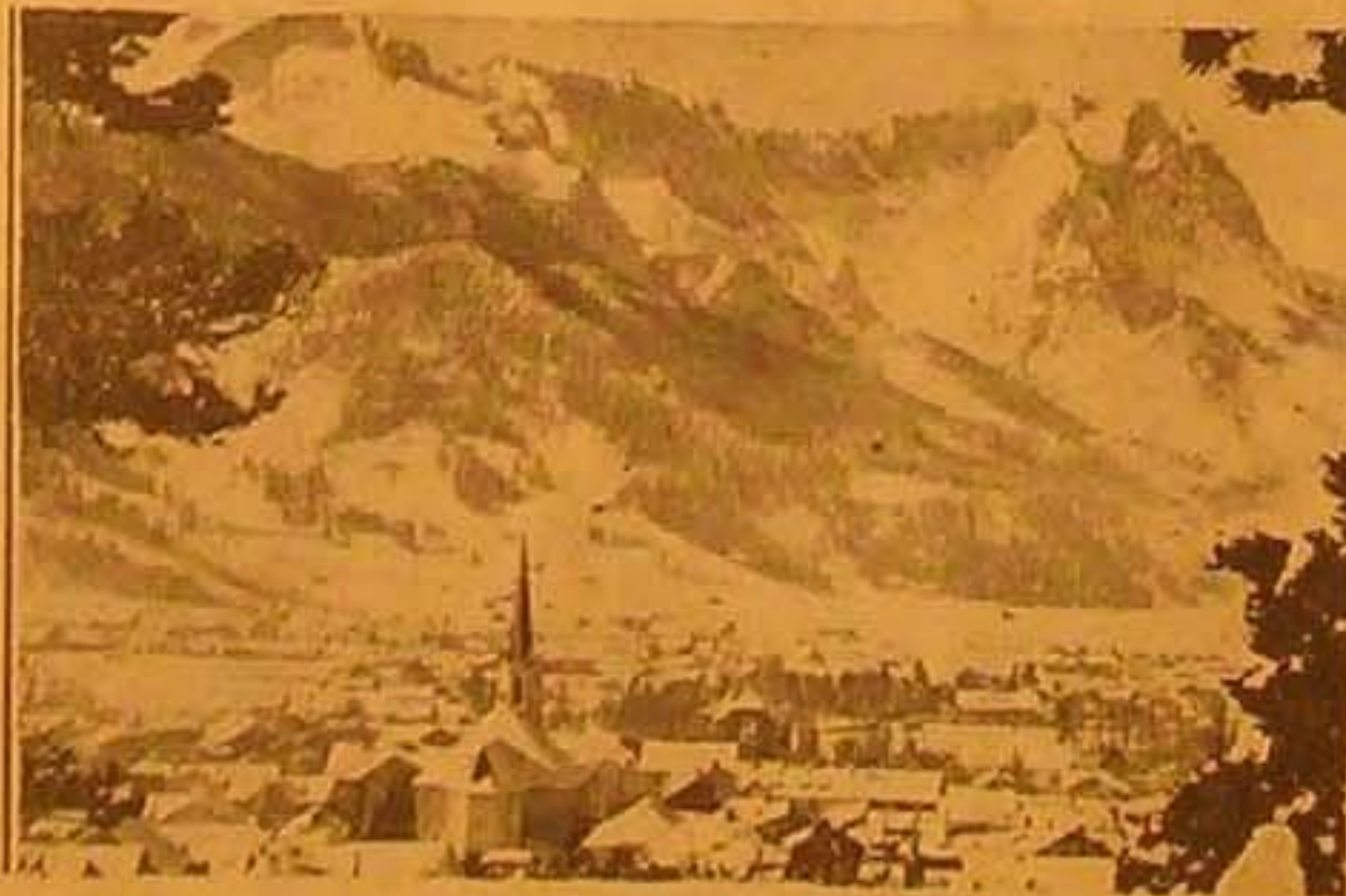
صورة جميلة تمثل مدينة غامرش في جبال الالب حيث قررت لجنة الانساب الاولمبية اقامة دورة الانساب القوية لسنة ١٩٤٠ فيها