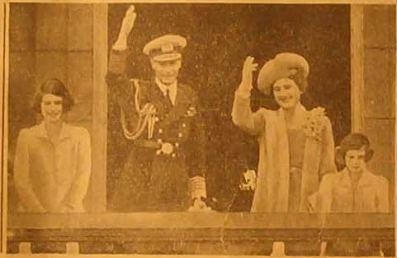
ملكنا الانكارز بدون التحية للجمهور من شرفة قصر بكينجيام بعد عودتها من الولايات المتحدة وقد وقفت الى جانبها الاميرة الزيات ولية العهد والاميرة مريث روز شقيقتهما