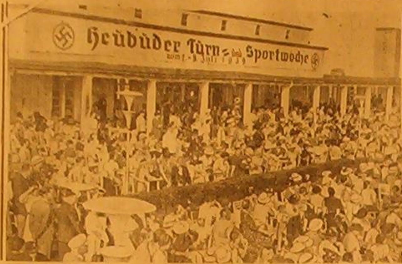
صورة تمثل الجماهير المتشددة في أحد الملاهي البحرية في مدينة دازنغ الحرة وقد انصرفوا للتسلية غير عابئين بالخطر الذي يهدد العالم من جراء مشكاة ادم