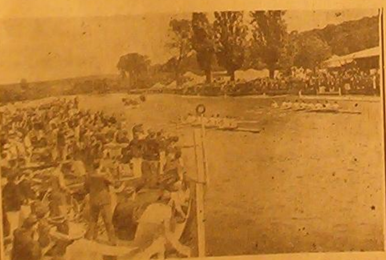
احد مناظر حياق الزواجر السنوي الذي يجري سنوياً بالقرب من على نهر التاميز وتشارك فيه معظم نوادي لندن الرياضية ويرجم تاريخ هذا السباق الى مؤسسة خلت