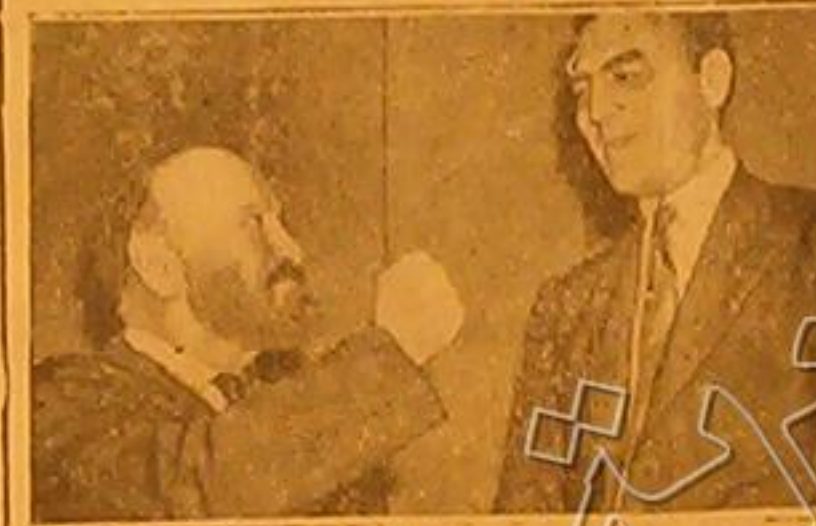
مؤتمر لوكهام و هاميلتون ديش «مؤتمر المجلس المرموق لأميركي ومن اكبر معارضي سياسة الرئيس» وذهبت بشارة قانون الحياض الاميركي