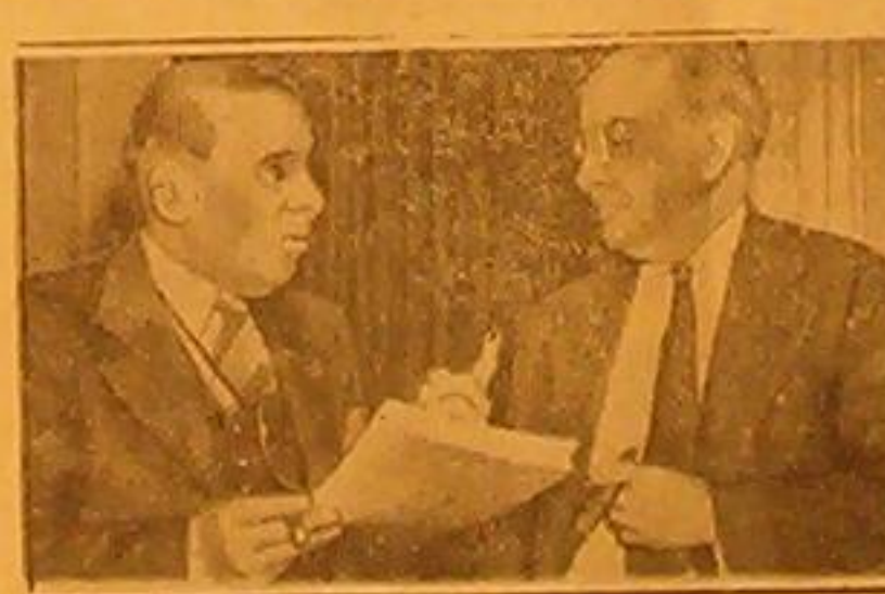
يقوم فريق كبير من اعضاء مجلس الشيوخ الاميركي بممارسة سياسة الرئيس روزفلت في التدخل في مشاكل اوروبا ويرى في الصورة عضوات من معارضي سياسة روزفلت وهما لوتر جونسون وسول بلوم. ويرد اتهما يومياً في البرقيات لتتلقه بمناقشة مشروع قانون الحياض