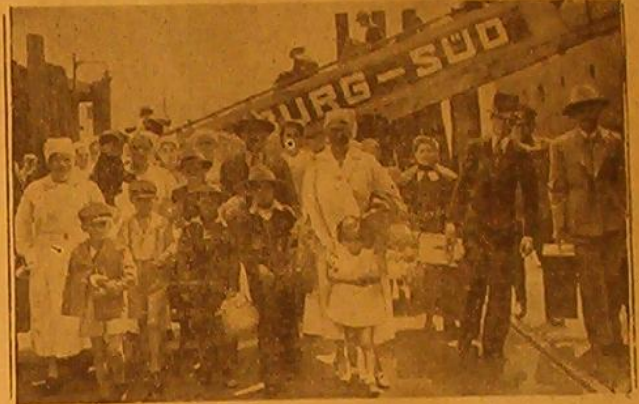
وصل الى ميناء هامبورغ ٦٠٠ من الرمايا الالمان الفاضلين في انحاء اميركا الجنوبية على أثر توتر الحالة الدولية والخوف من نشوب الحرب ويرى في الصورة بعض العائلات عند نزولها من الباخرة