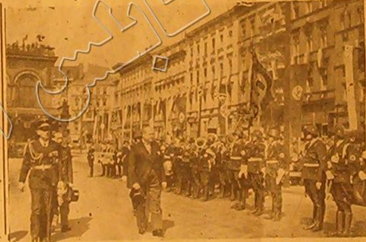
رئيس وزراء بلنداريا وجمانه فوندر جيترو بوزير خارجية المانيا - تعرض الحرس الذي كان في استقباله عند مقابلة له ولوقداه تمت الدوائر السياسية لهذه القاعة نظراً للعادة القاعة الان بين الدول الديمقراطية ودولتي المحور

فوق : من الصور التي لقطت في نيويورك : - الملاكمة التي جرت بين الملاكم الرشيح جولوس والملاكم توني جالنتو والتي انتهت بفوز الرئيس وبذلك احتفظ بمطولة العالم في الوزن الثقيل « الى اليسار » : الملاكمة الحديدية المأهولة التي احتضنتها وزارة البحرية الاميركية في الملاعب التي تهي الان لانتقال « الغواصة » سكواوس « من قعر البحر