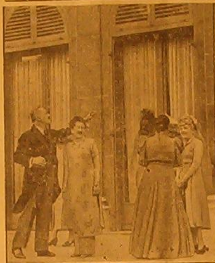
المسيو ليرودومجانه اميراطورة انام بعد للأدبة التي أقامها تكريماً لاميراطور واميراطورة أم