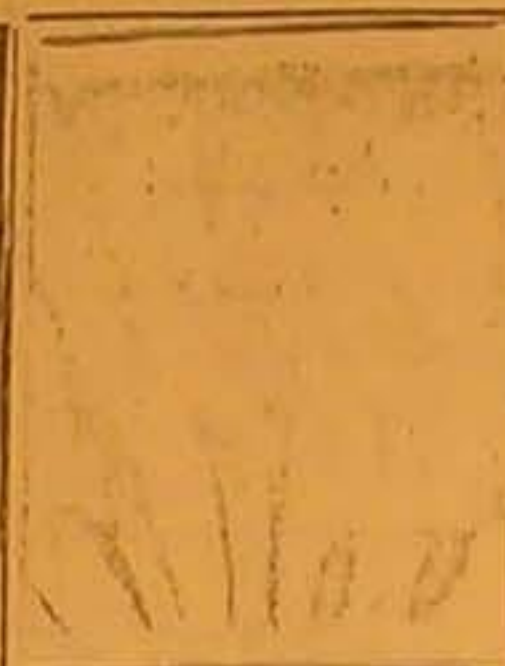
اللاك الماني ماكس شمبلنغ وقد تبارى أمس مع منافسه جوليس اللاكم الزنخي فتغلب الاخير عليه بضرورة قاسية في الدورة الاولى