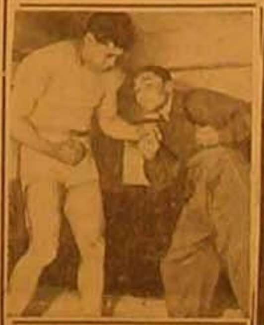
لللاك الزنخي جوليس الذي تازل ماكس شمبلنغ وتغلب عليه في الدورة الاولى مطبعة جريدة الدفايع - يانا