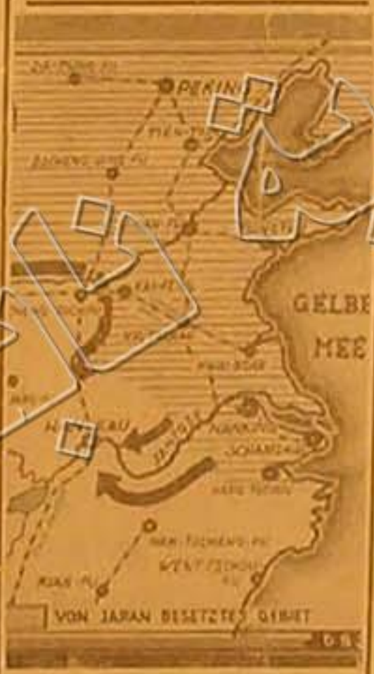
دمر الجيش الصيني جيم المسور الواقعة على يد بانغسي فاي ذلك الى قبضان حال تموت بسبه الوف الكبلو مرات وقد نتج من ذلك ان تأجل زحف اليابانيين على مدينة هكاو. وترى في الخريطة المقاطعات الصينية التي احتلتها اليابانيون وهي مخططة بخطوط متوازية