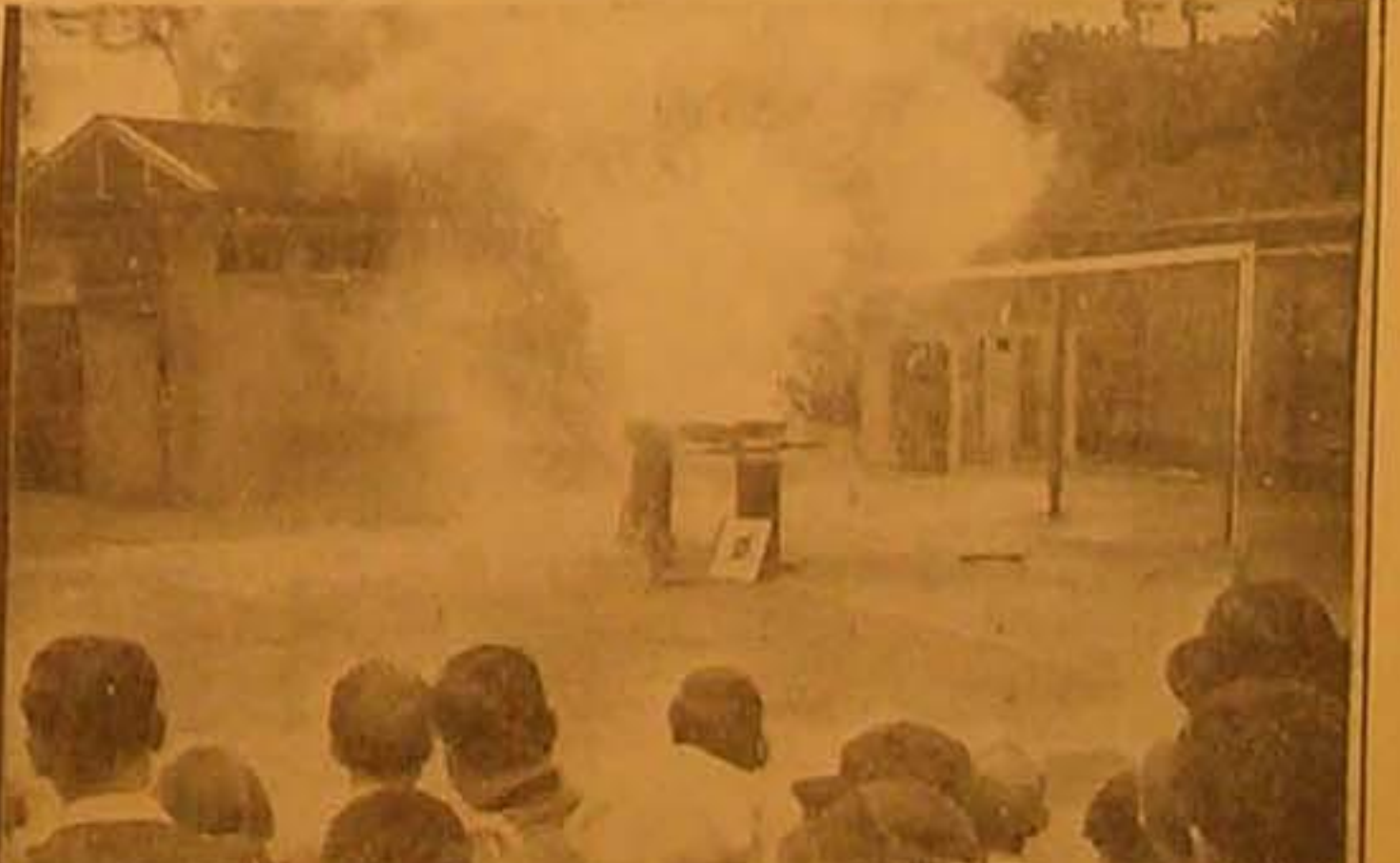
تتم الصورة التجربة التي احدثت في لندن لتعليم الجهور معرفة اثناء الحرائق التي تنجم من القاء القنابل من الجهور وقد اخترع أحد الاختصاصيين نوعاً من الورق غير قابل للاشتعال الملبس بالمهات والابنية وبذلك لا تتسكن نيران القذائف من الاندلاع في هذه البنات