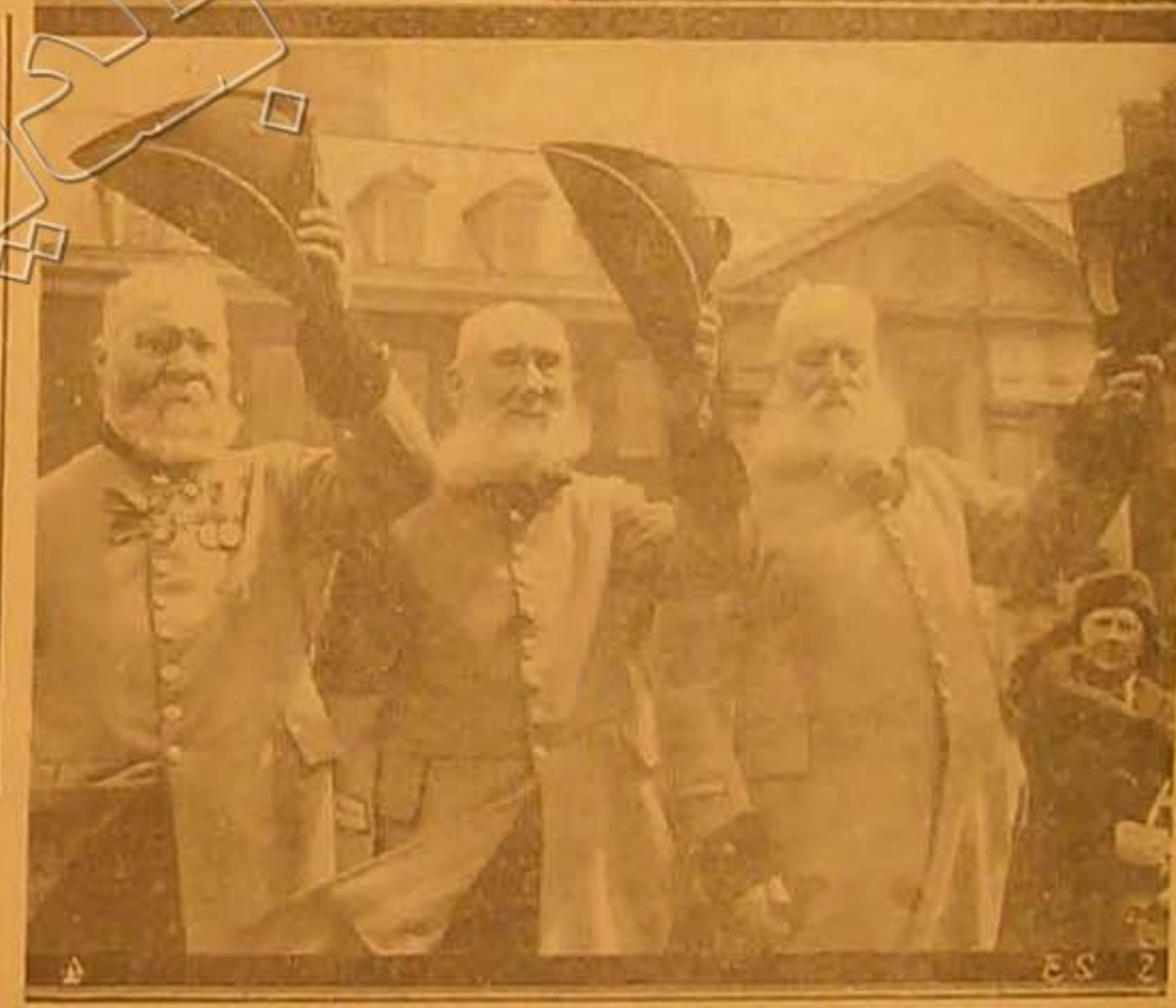
ثلاثة من الجنود المحررة الذين يتبرؤوا بملعباً شمس في لندن اثناء هجرتهم لتكري الملك شارلس الثاني في الاحتمال السنوي الذي اقيم بمناسبة هذا للتحا الذي انشاء الملك المذكور منذ عدة اجيال على اثر عرته من المنى لاقامة الجنود التي تقدمت الشجوخة عن طائفة