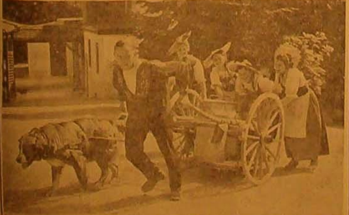
منظر يشاهده زوار سويسرا والدين يتجولون في قراعا في صباح كل يوم عندما يأتي باحة الحليب عمالهم حليهم على مراب يجرها قوي ويساعدونهم الجركلاب من النوع الخدس هذا العدل وتدعم الغرائب من الخلف بضم الحسان من نبات القرويين