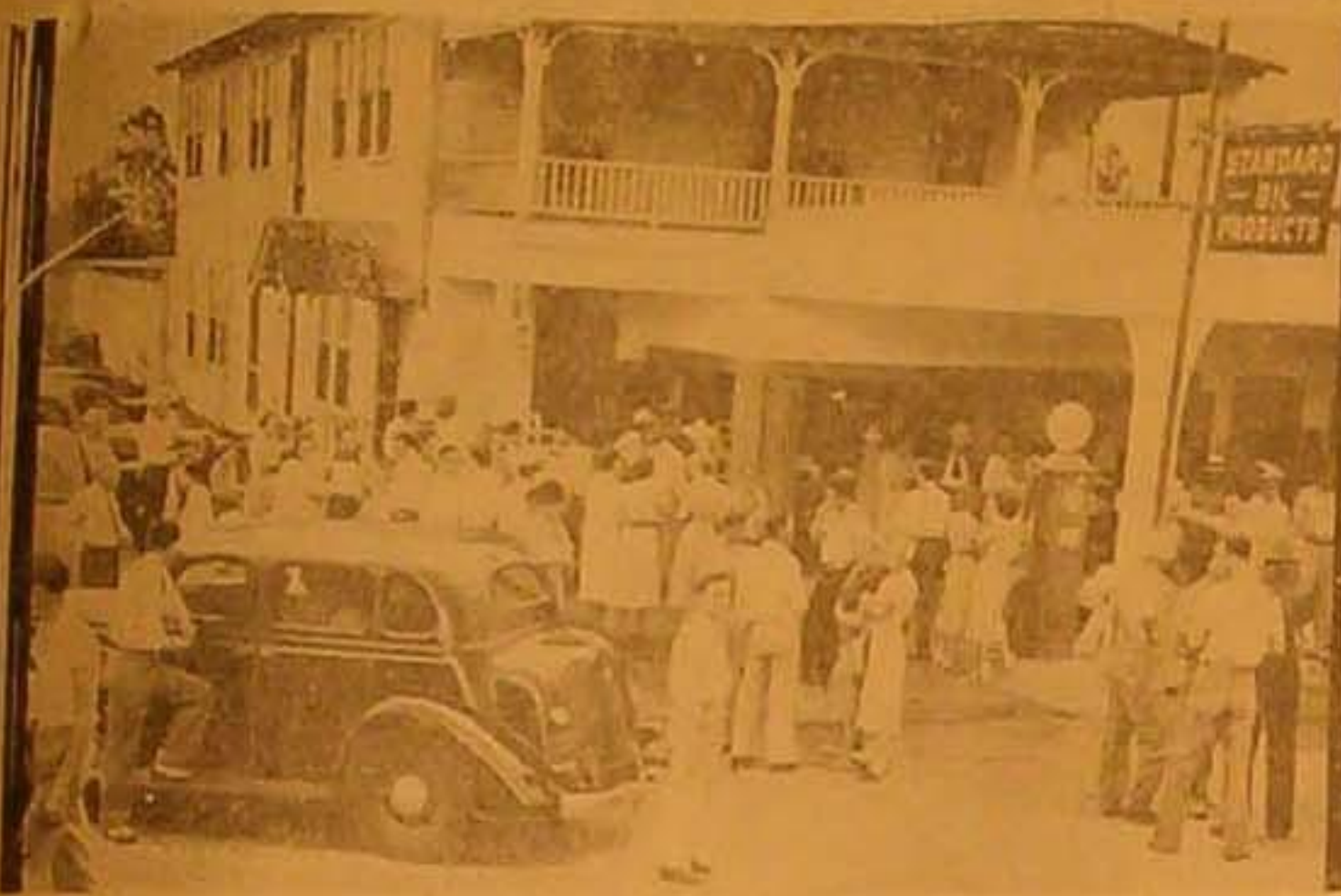
أثارت حادثة خطف الطفل الاميركي الاخيرة في برنستون حفاطة الجحيم على مرتكبي هذه الجرائم التي يكثر حدوثها في امريكا ويرى الناظر الى الصورة التفاتاً فريداً من هؤلاء الذين حولوا المدي الطفل الخطف لتتمير عن عطفهم عليها واستنكارهم لهذا العمل الوحشي