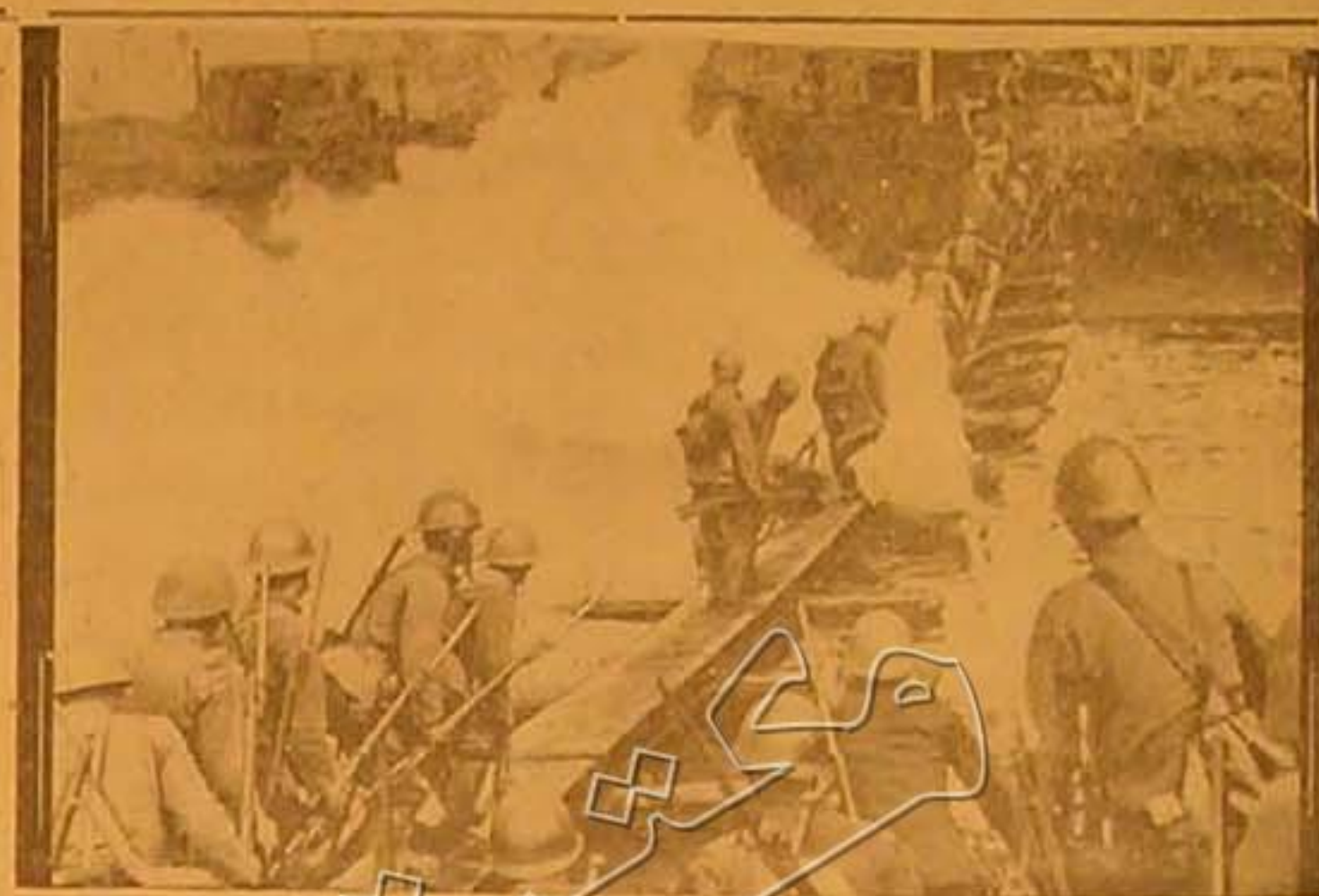
تفكر اليابانيون من التقدم في ارضف الاخير الذي قاموا به من التهريل وامطلة شباب اردنناهم كضيف حال دون ان يرام الصينيون والصوريون فربما من الجهد الياباني وهم يمدون جسوراً على نهر الدكا