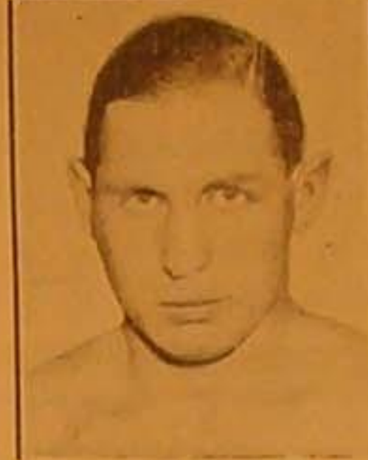
المسرحي تشارلي بطل أوروبا في الملاكمة بالوزن الثقيل