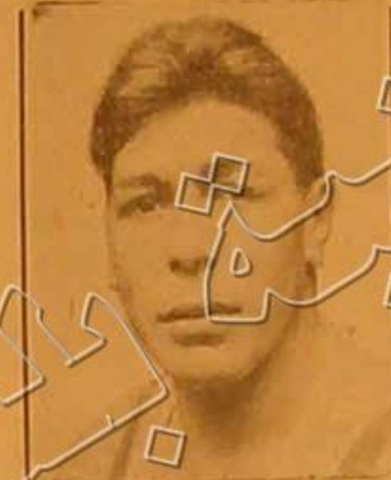
البر اوبرين كاتين وقد نازل بشارلي للحصول على بطولة أوروبا في الملاكمة