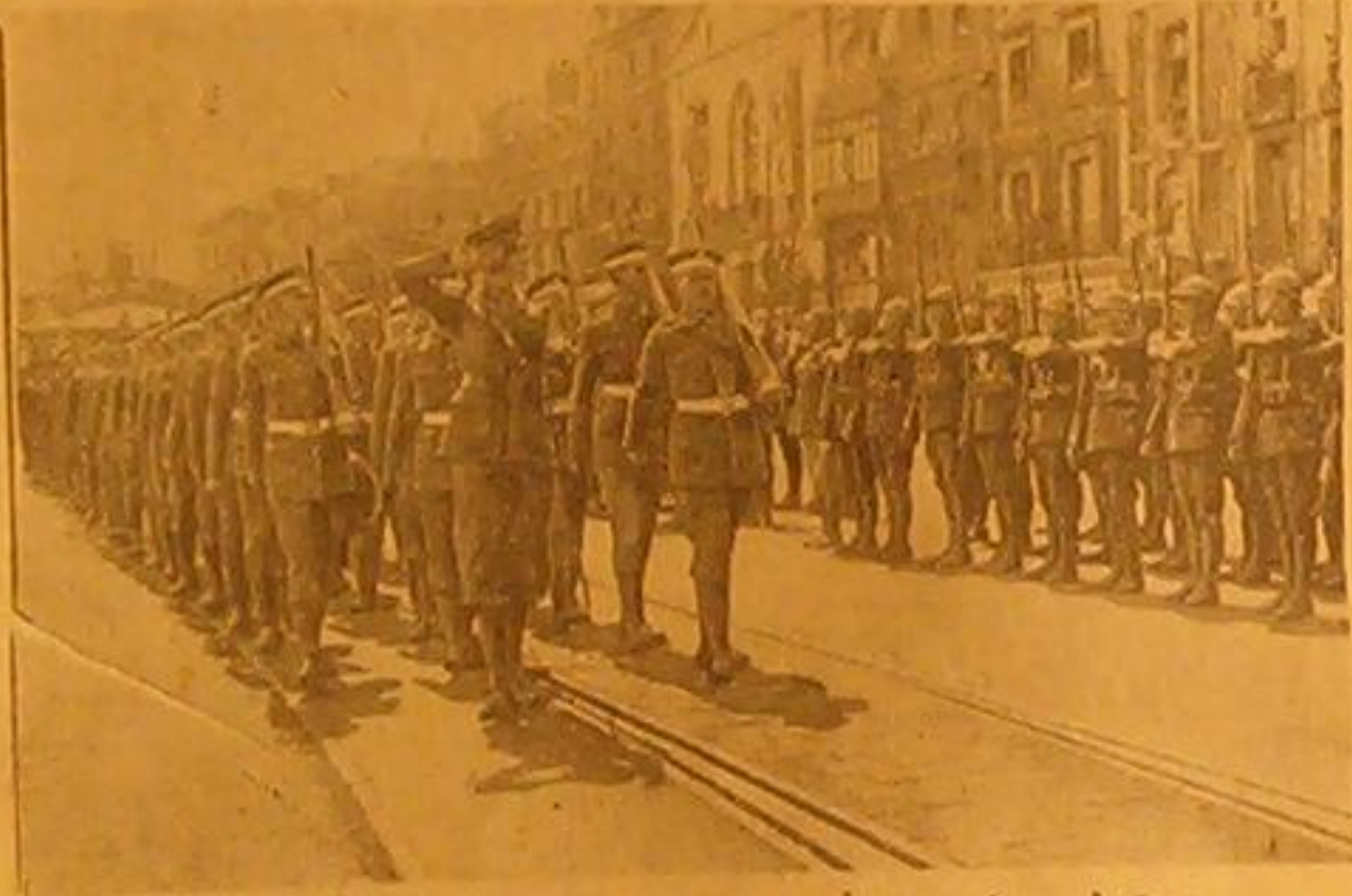
فرقة الحرس الملكي البريطاني عند مغادرتها باريس بعد ان اشتركت في الاستعراض الذي جرى بمناسبة عيد ١٤ تموز وقد ظهرت احدى الفرق الفرنسية في وداعها