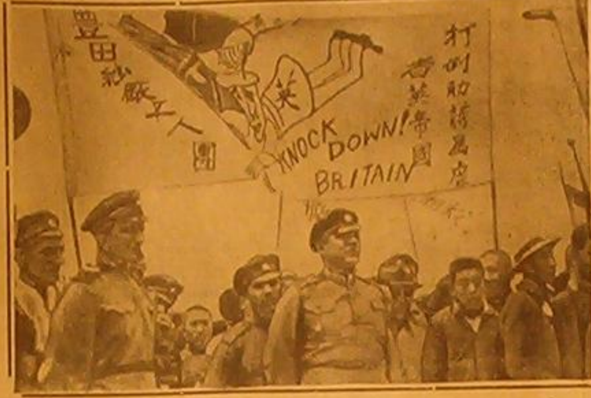
صورة تمثل مظاهرة عدائية ضد البريطانيين في مدينة تسنغتاو. وقد حمل المتظاهرون لوحات تحمل بشدة على البريطانيين بالفتن الانكليزية واليابانية. وقد جاء في البرقيات الاخيرة ان هذه المظاهرات تمت في عدة انحاء من الصين

المظاهرات ضد بريطانيا في الصين - اجتماع وزير خارجية ايطاليا بالجنرال فرانكو -