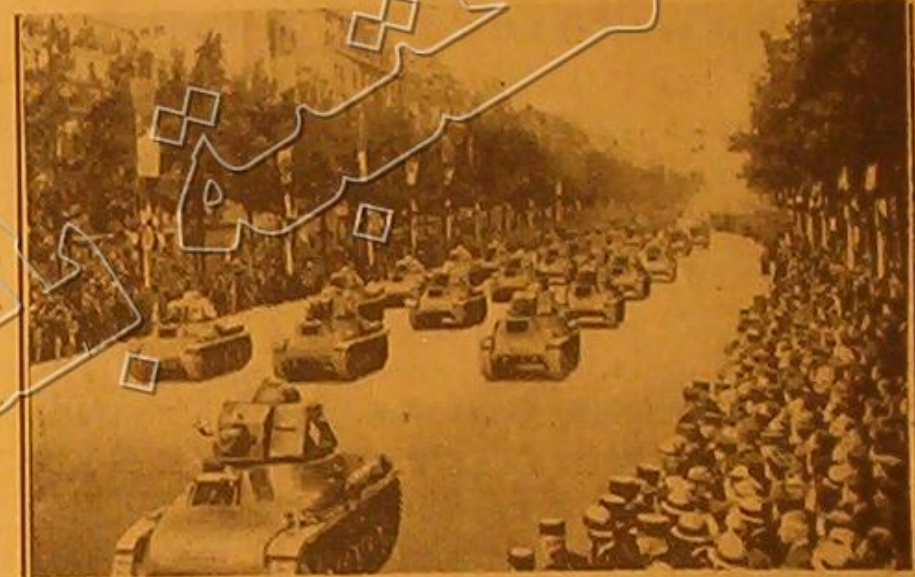
مرب من الدبابات الفرنسية والبريطانية تسير في شارع الشانزليزيه في باريس اتناء العرض للشرك الذي جرى يوم ١٤ تموز بمناسبة مرور ١٥٠ عاماً على الثورة الفرنسية