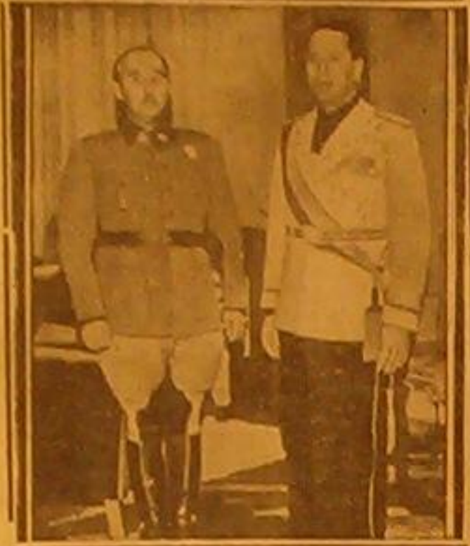
صورة تمثل الكونت شبانو وزير خارجية ايطاليا مع الجنرال فرانكو عند زيارته له في الاسبوع الماضي في سان سباستيان

الاشتراكات في فلسطين ١٥٠ من سنة في البريد الدائم ١٨٠ * في خارج الاقطار ارجية ٣٠٠ * وكالة القدس لتقود ٢٤١٢ حيفا : ١٣٥٨