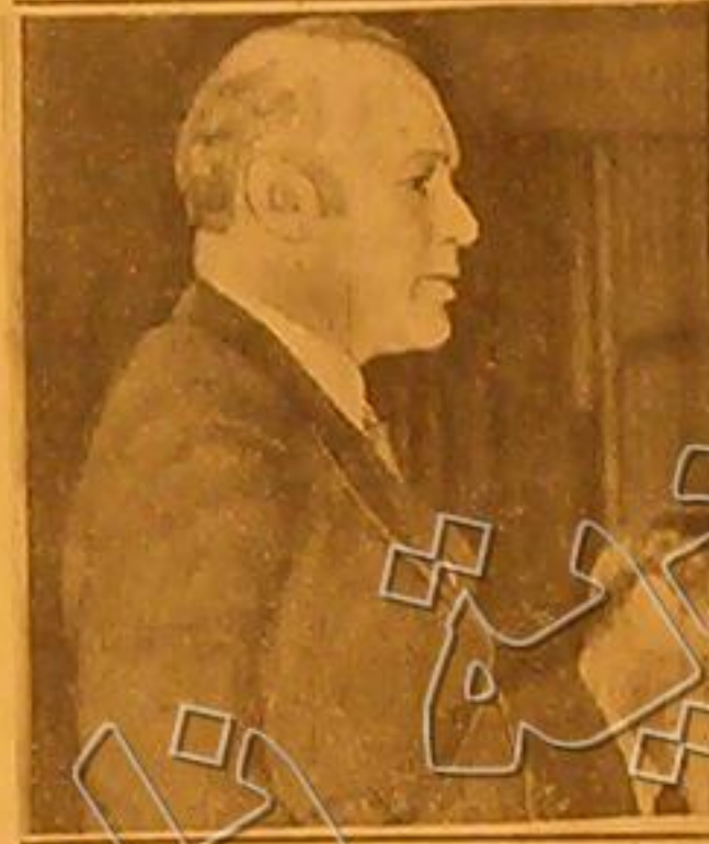
الداعية الانكليزي هيثمان كينج هول الذي كتب الخوف الرسائل فيها الدعوة ضد حكم النازي ورحلها الى الامان بالبريد وقد لقيه الدكتور غولز (العملاق الهولندي)