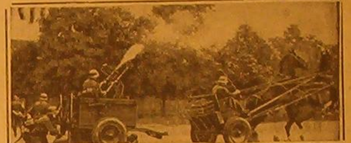
أحد مناظر للتاورات التي قامت بها فرقة للدفع للقنابل للطائرات في الجيش الألماني في مدينة همدلنبرغ عند الحدود الغربية

المظاهرات ضد بريطانيا في الصين - اجتماع وزير خارجية ايطاليا بالجنرال فرانكو -