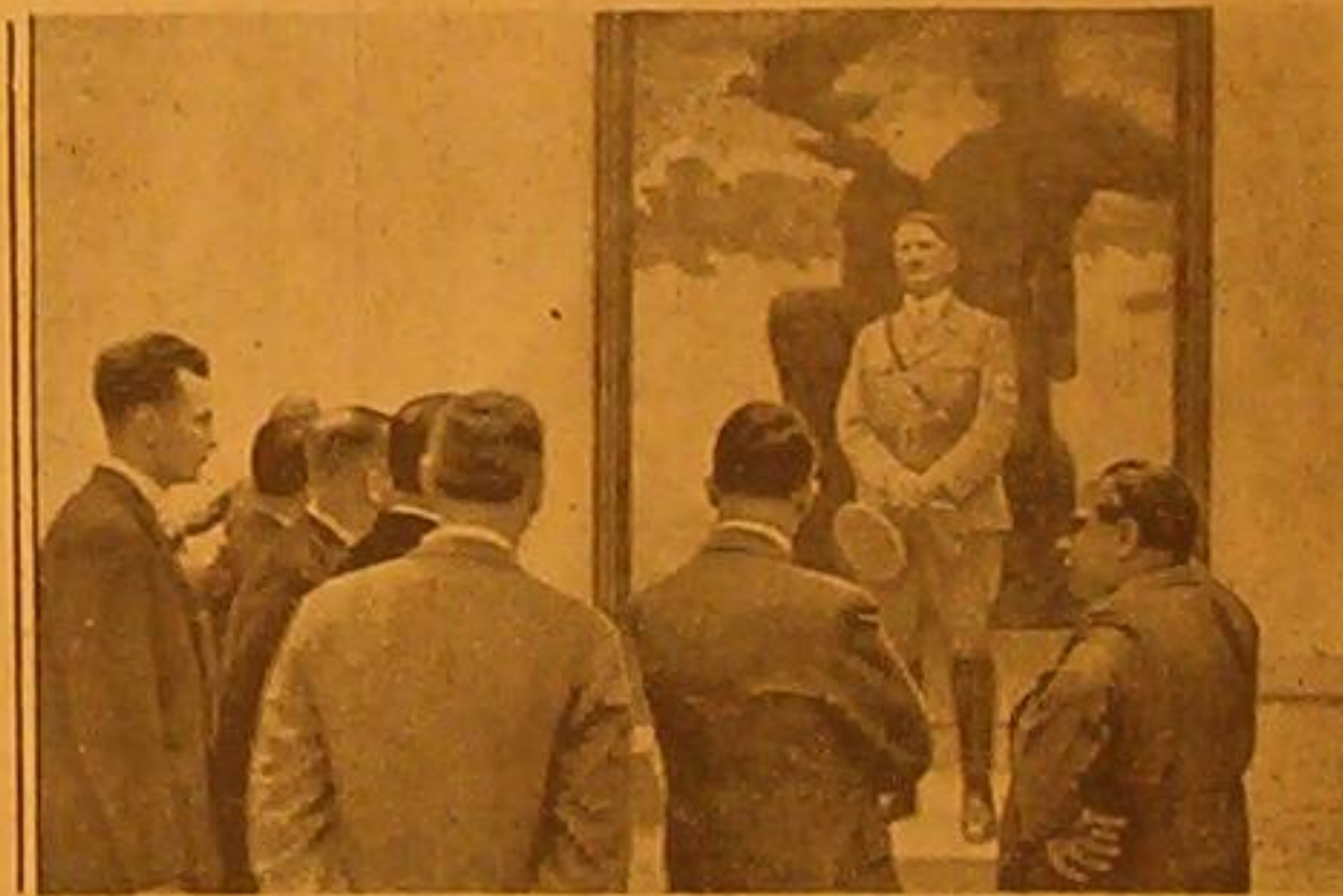
افتتح هتلر في الاسبوع الماضي معرض الفن الألماني وهو يرى في الصورة يتفرج على لوحة عليها رسمه اتناء تفقده انحاء المعرض