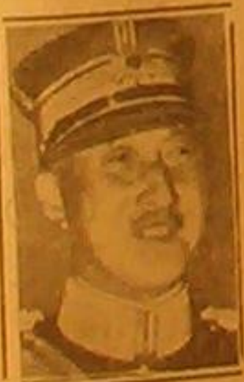
الجنرال الكونت تروخي القائد العام للقوات اليابانية المحاربة في الصين