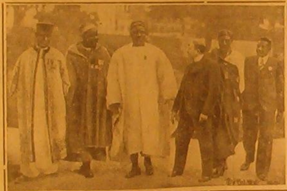
للمعير مانديل وزير للمستعمرات الفرنسية يرافق بعض الامراء الزنوج من مستعمرات فرنسا في أفريقيا عند ترحيلهم في إحدى حدائق باريس وذلك بعد حضورهم احتفالات عيد ١٤ غوز