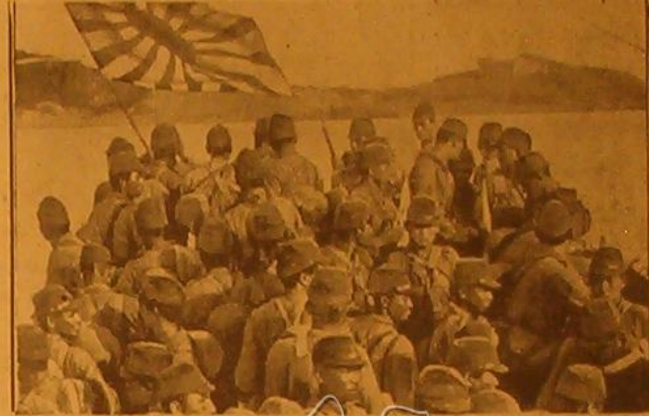
بعض الجنود اليابانيين يملأون العلم الياباني عند نزولهم في ميناء هونغ كونغ الذي احتلوه أثناء الحرب العالمية الثانية في مناطق العنف الصيني

القوات اليابانية تحتل جزيرة سواتو - الاحتفال بعيد ١٤ غوز في باريس - الحالة في تيان تسين