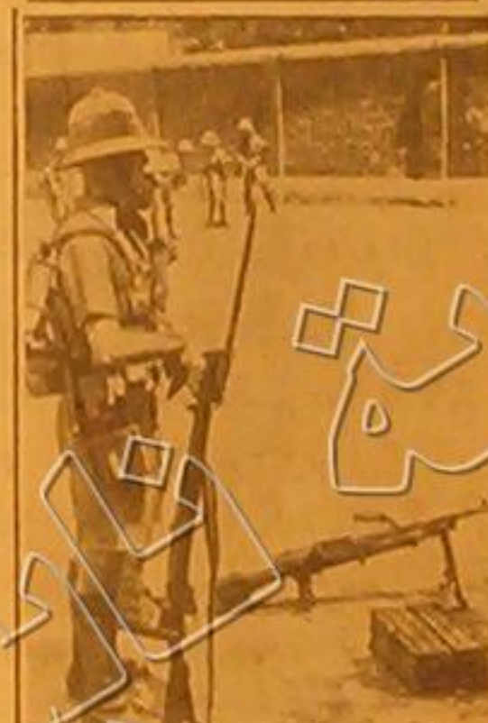
جندي بريطاني بسلحه الكامل وهو يحرس المنطقة البريطانية المحاصرة في تيان تسين في شمال الصين