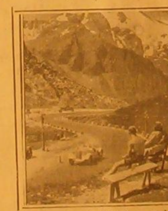
أخذت هذه الصورة لجبال الالب لمناسبة قرب للباراة الدولية لعباق العبارات التي تجري كل عام