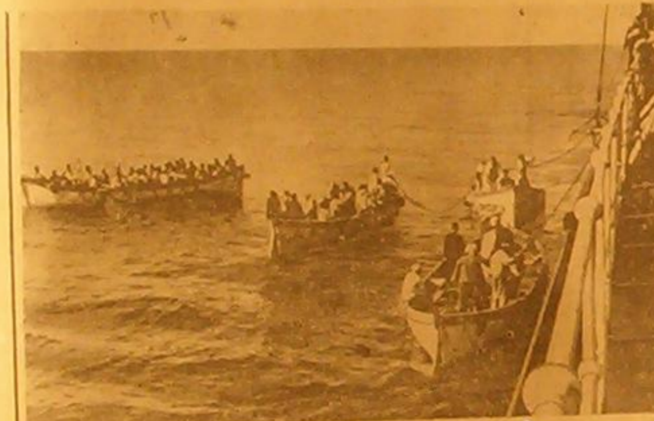
الخرة اليابانية (يوكوبومارم) التي احتزقت انهاء سفرها وقد ازلت جميع ركابها في المحيط وهددم ٢٢٧ راكباً في قرارب النجاة وظلوا كذلك حتى انجدهم احدى البواخر الاميركية