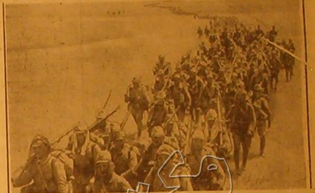
فرقة من العاة الياباين انما زحفها على جبهة كوكورومي وجبهة شاقوشيمو العيوية