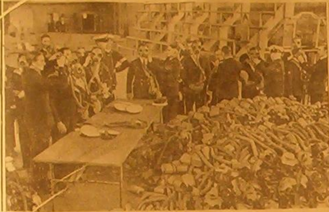
ابتدأت في إنجلترا التاورات العيوية للاسطول البريطاني وقد اشترك في الاحتراض عشرة آلاف شخص في ٤٨ بارجة وتراهم بلبسون الكمامات الوازية قبل التاورات