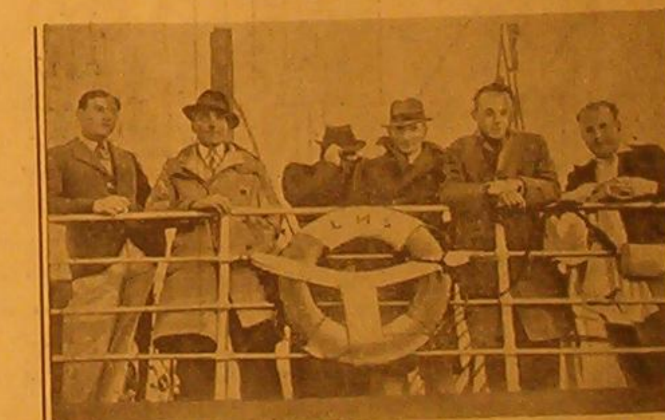
قامت الحكومة البريطانية مؤخرأ بطرد الزنايا الالاندين من لندن على اثر تعدد حوادث الانفجارات وترى في الصورة ستة منهم على احدى البواخر تحت حراسة البوليس