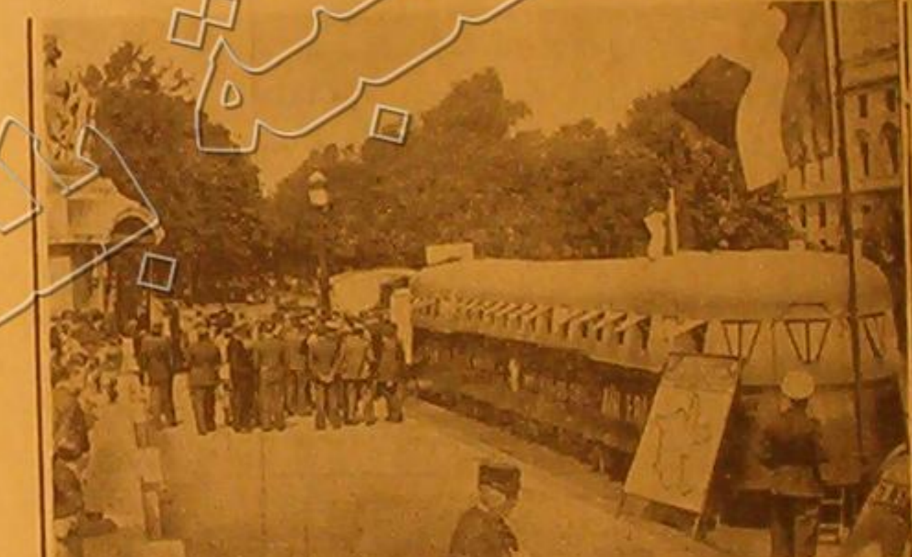
على اثر نخرج الحالة الدولية قامت فرنسا بداية واحدة الطاق لتطوع في الجيش . وترى في الصورة قطار حديدي امد خصيصاً لادمايه لتطوع الشبان في سلك المارين