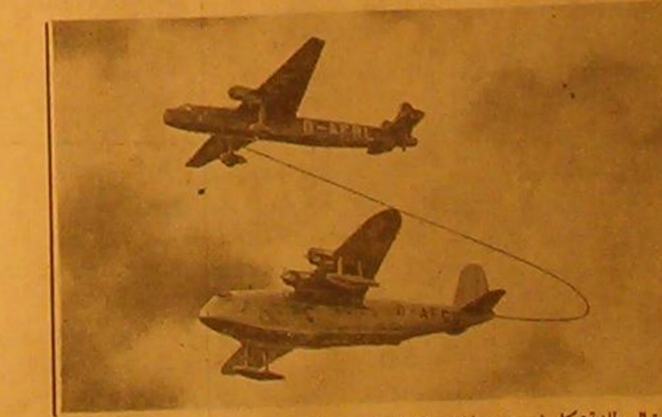
الطائرة البريطانية «كابرت» من طلعات الاملاطليكي وقد طارت من صوبجتون الى اميركا بلا توقف . وترى احدى جاملات التنايل تزودها بالناز بالهظة (ممسورة) وهي في الهواء