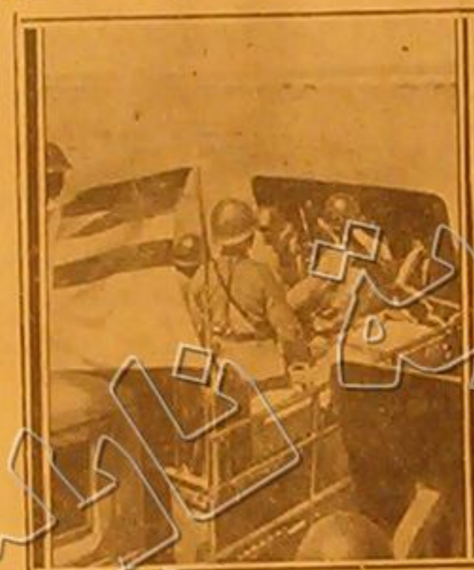
لا تزال للبارك دائرية بين منشو كو ومنغوليا . وترى في الصورة الجنود للتشوكين يقررون المواقم الامامية من الخط الروسي بمدانهم وخلقهم اعلامهم