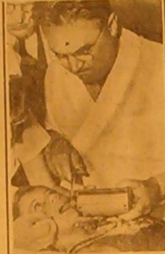
تتل هذه الصورة فتاة اميركية وهي تحت العملية الجراحية وذلك بعد أن دعت لها لاجابة بيرا ولم تستعلم اخراجه الابمالية جراحية