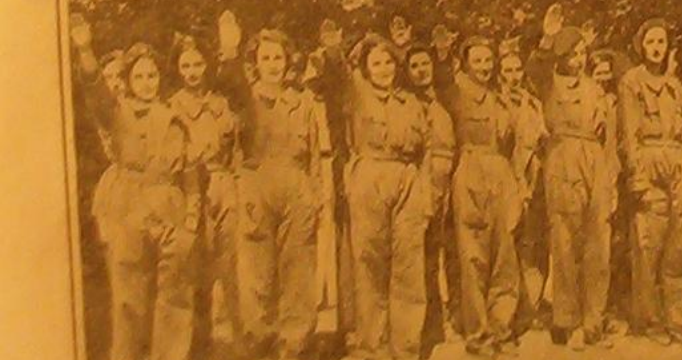
تخرجته وخرأمن مدرسة الطيران الحربية في برطانت عاصمة بريطانيا