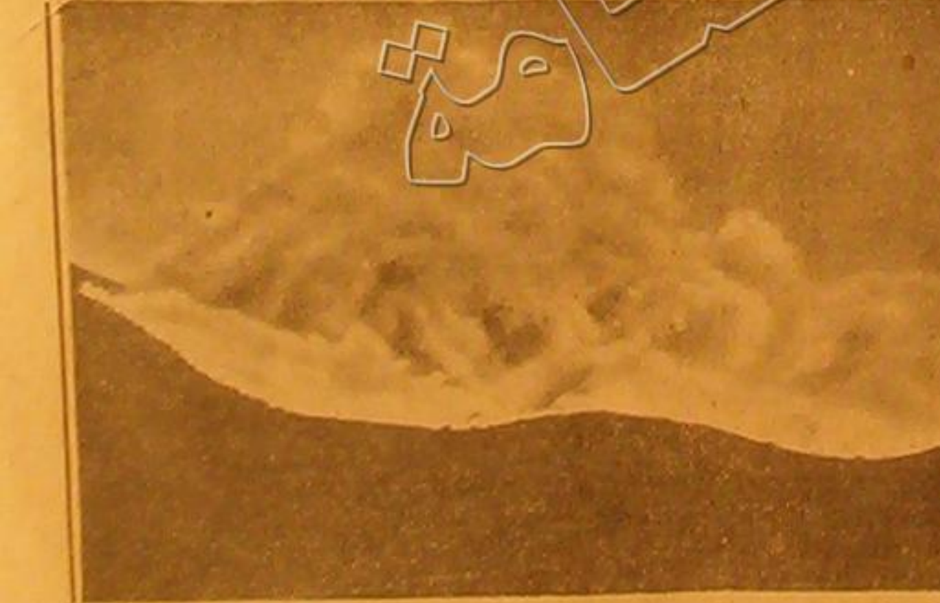
هل هذا ركاب هائج ؟ كلاب حرس يحترق في كاليفورنيا وقد استقرت فيه حبة الات شيرة