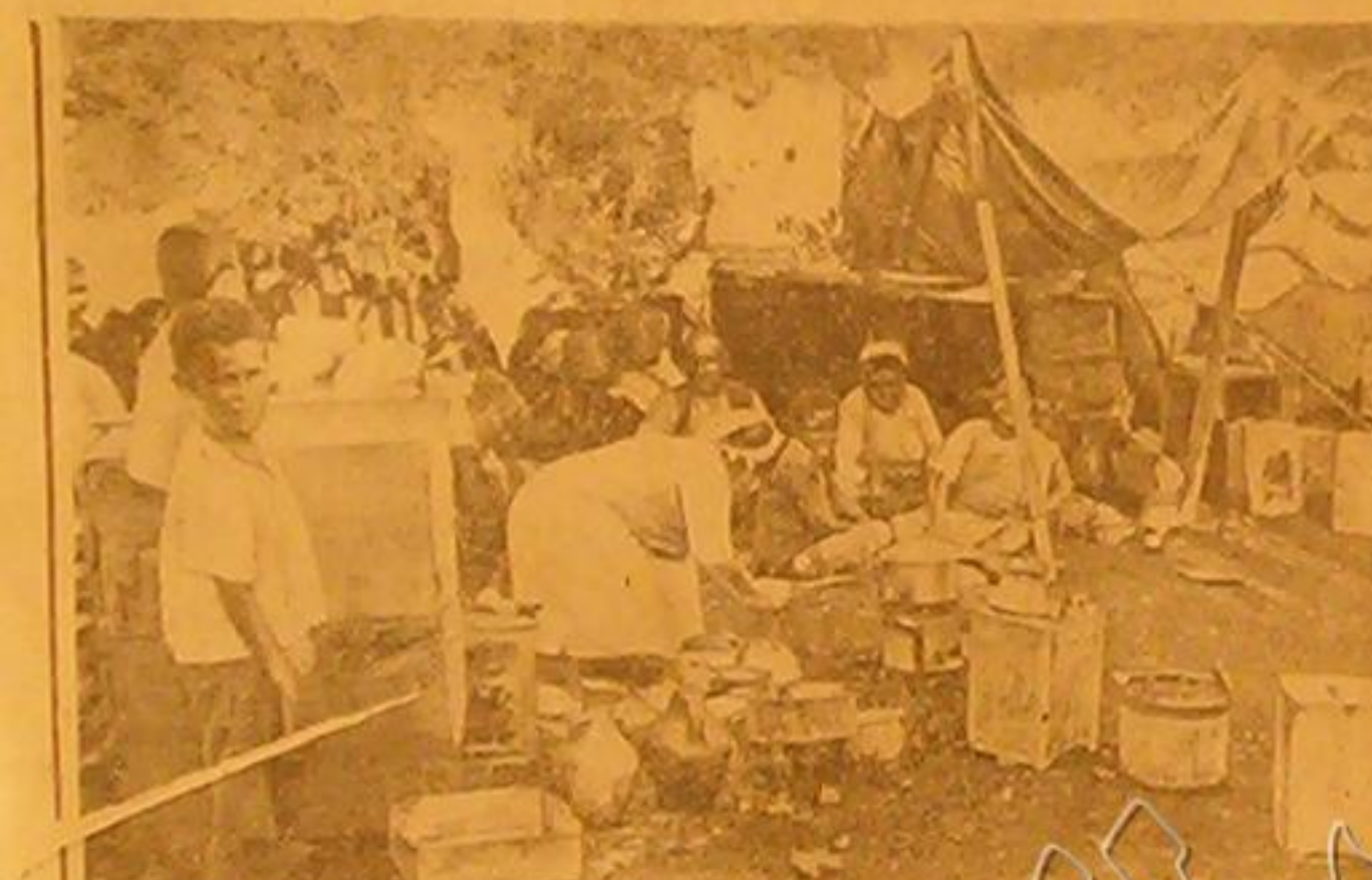
من مآلات الايدي من الامم الذين هم وامن الامم في سوريا وقد خصصت الحكومة السورية مبلغ ١٠٠ الف ليرة سورية لزيادة من العودة في الخريف التي امتد طر