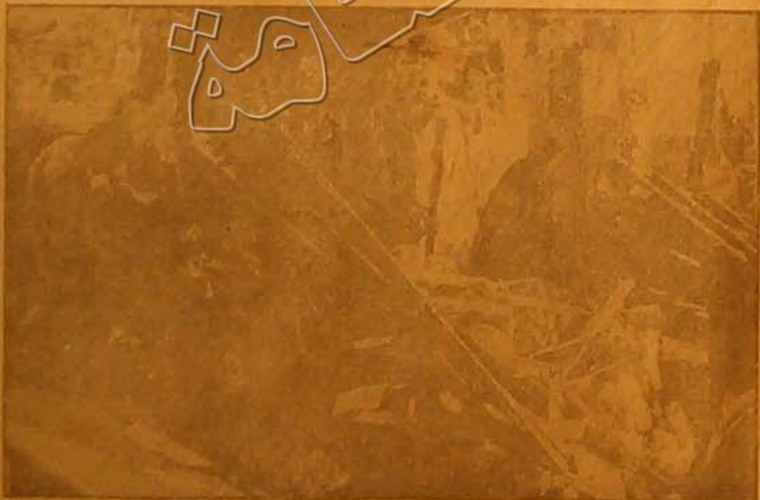
منظر آخر لبيوت المهدمه