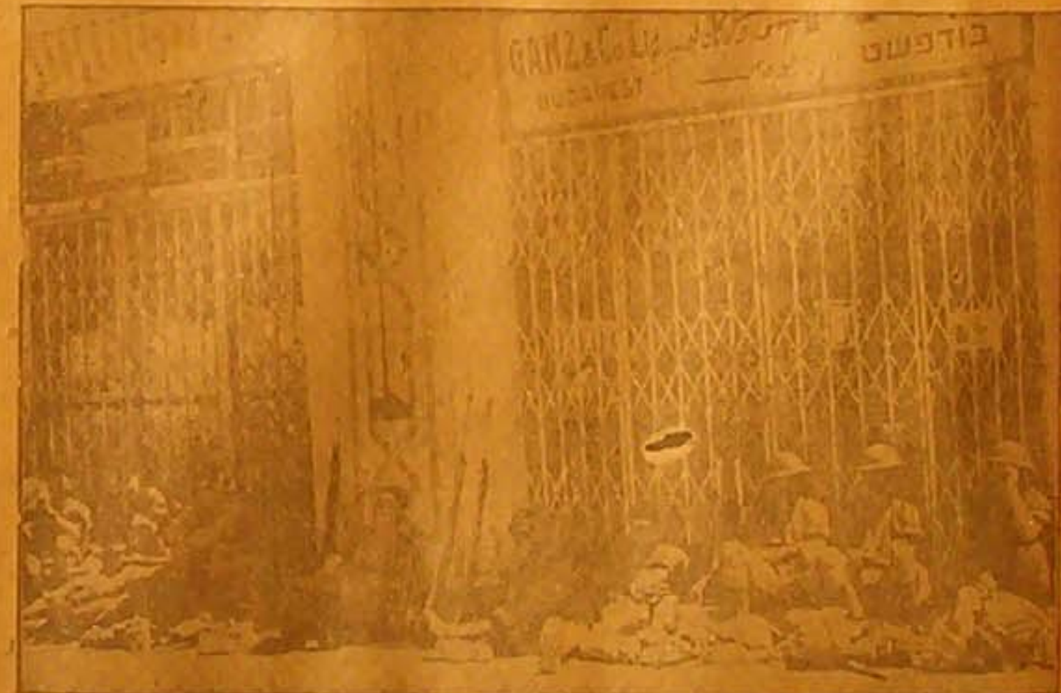
منظر لقسم من الجنود الذين احتلوا يافا يوم الهدم