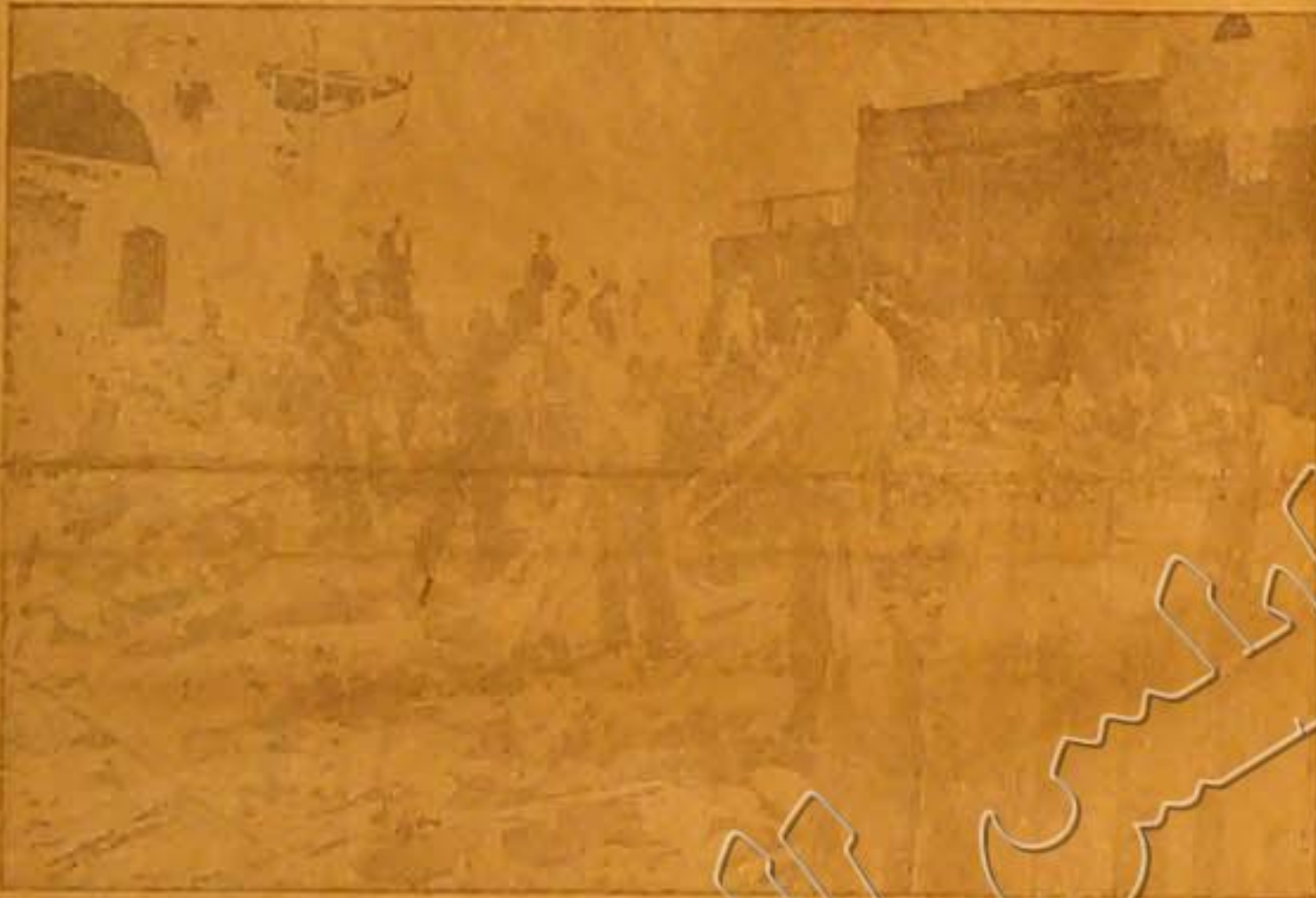
منظر آخر انجرار الديناميت في البلد القديمة يافا