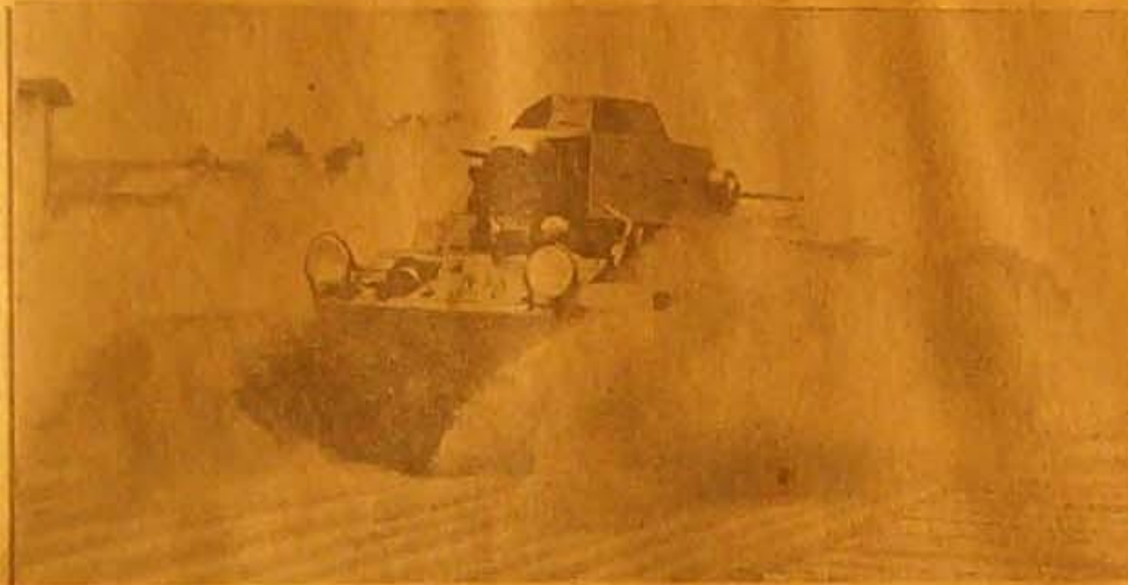
دابة امير كية من الطراز الحديث اشركت في المناورات الحربية في صحاري جنوبي الولايات المتحدة الامير كية ونقطه ٧٥ كيلو مترافي الساعة