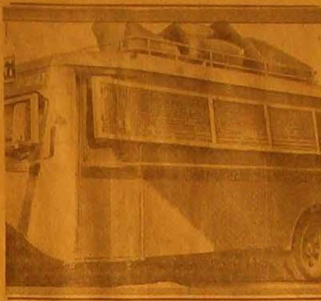
صورة احد باصات تل ابيب - بيت فيجان جنوبي بافا مسيحية بالاسلاك مع جميع جهاتها خوفا من رميها بالحجارة ولا تسير الا بحراسة البوليس (نشرت في صحف اورا)