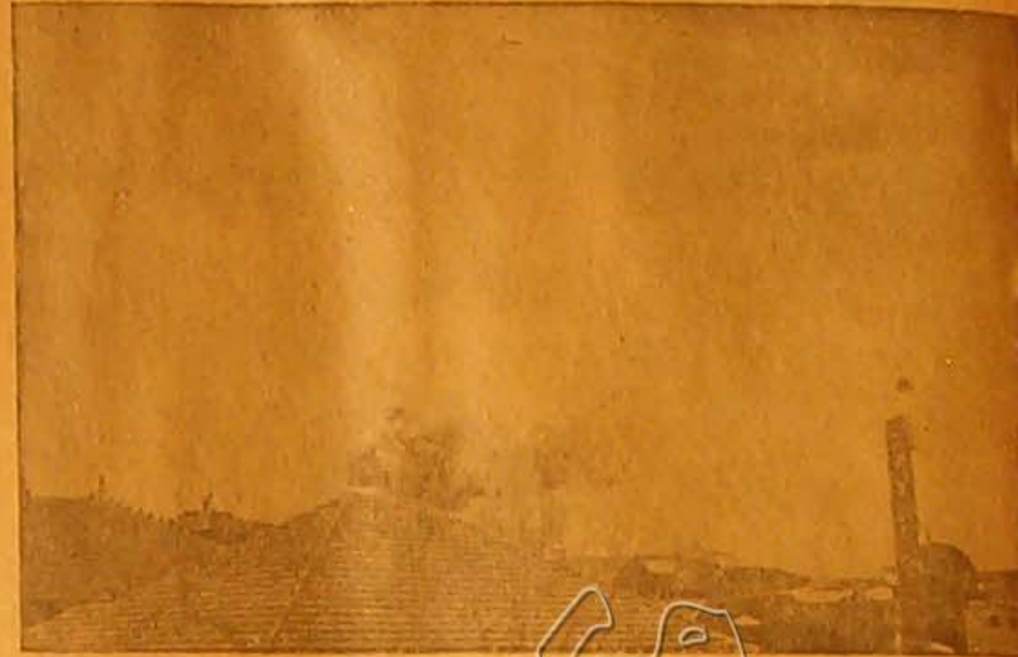
منظر انجرار الديناميت في البلد القديمة يافا