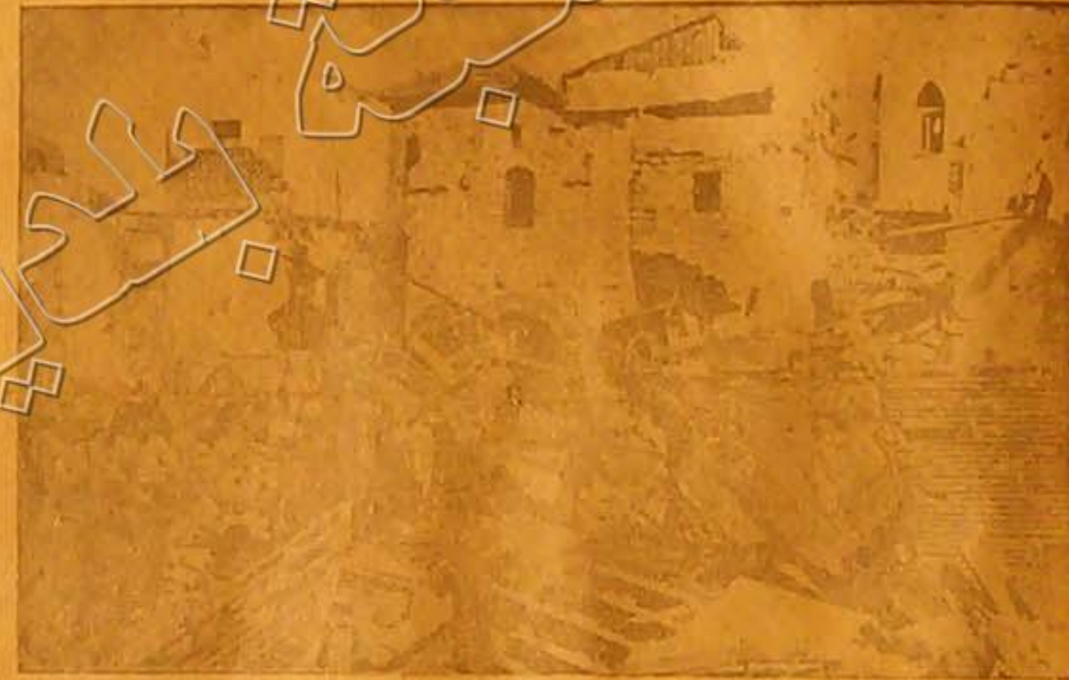
منظر لعدة بيوت تمقت بالديناميت