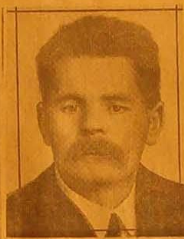
صورة الكاتب الروسي الشهير ماكسيم غوركي المتوفي وقد اشترك بالثورة الباشقية