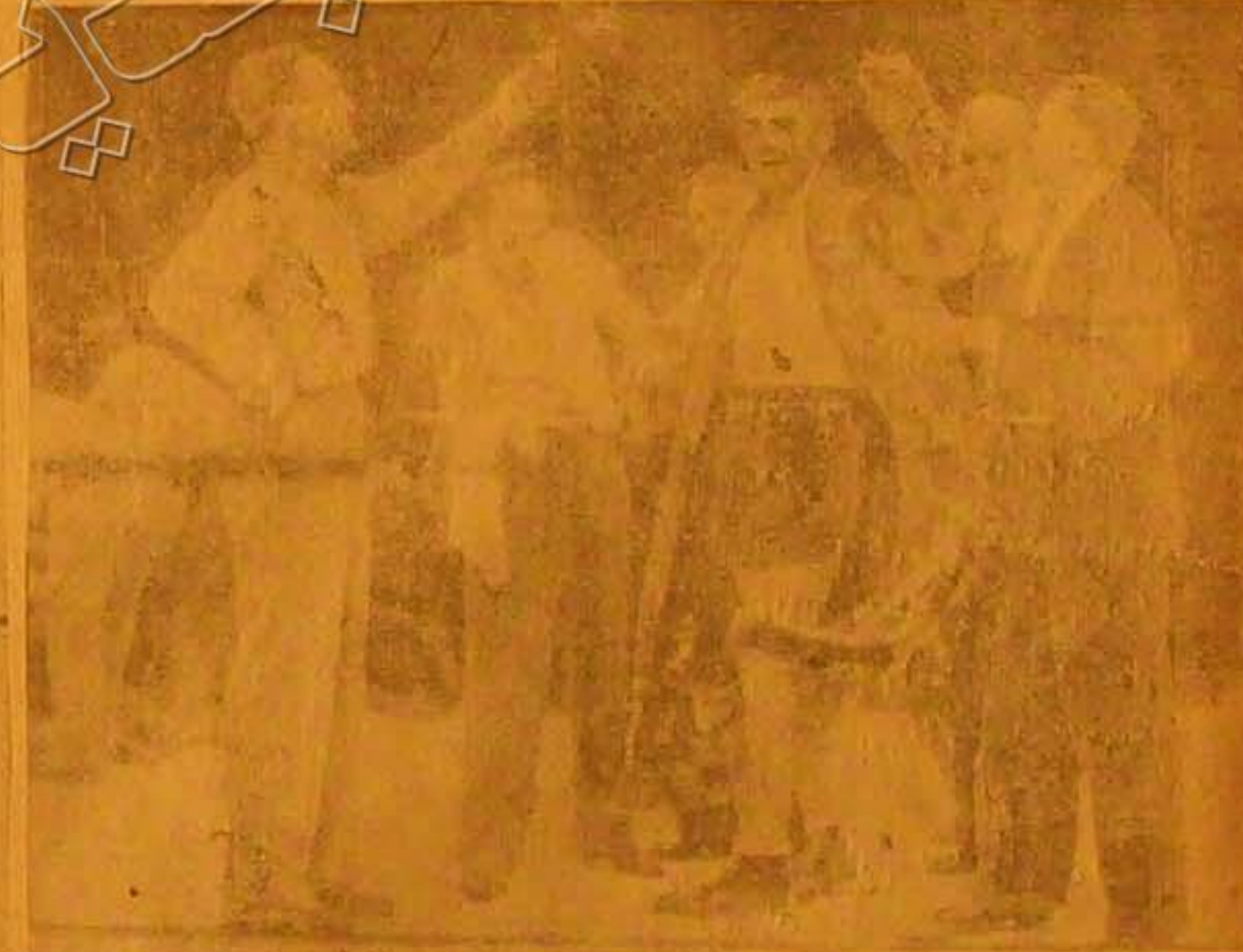
اللاكس الألماني الشهير ماكس شميلنج الذي فاز على خصمه النيجي جولويس في مدينة نيويورك