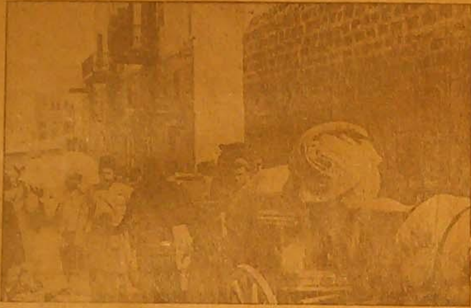
منظر للعائلات وهي تنزع من بيوتها