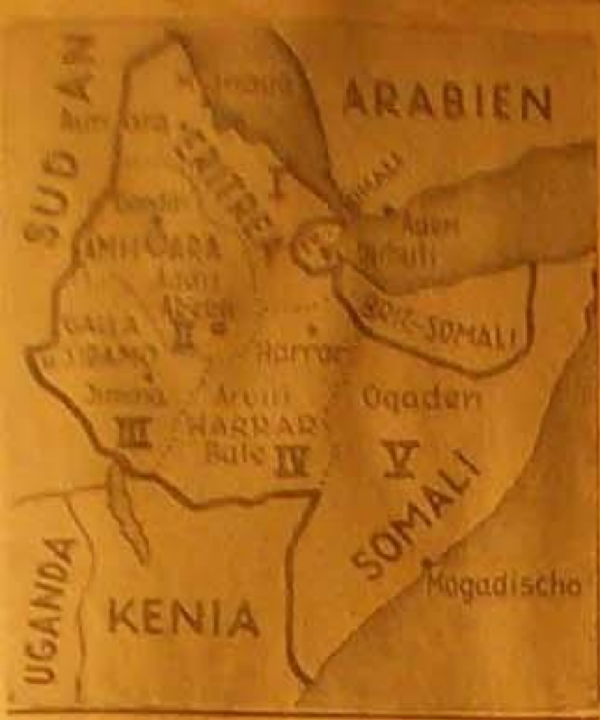
خريطة الحبشة بعد ان قسمتها ايطاليا الى خمس مقاطعات وهي ١ اريتريا و٢ عاصمتها اسمرا ٣ امرا و٤ عاصمتها غوندار ٥ وجالا وسيدامو ٦ وهرر ٧ والصومال