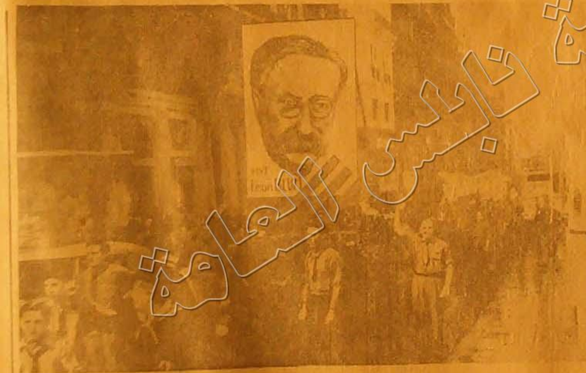
صورة احدى مظاهرات الاحتاج بفوز الجبهة الشعبية بفرنسا وقد حمل المتظاهرون صورة مكبرة للسيو ايون بلوم رئيس الوزارة