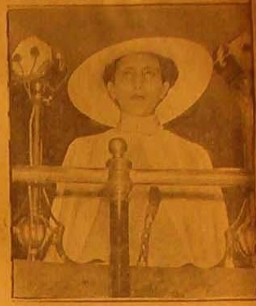
صورة ابنة النجاشي وعمرها ١٦ عاما وهي تلقي خطايا لياليا في لندن بالانكليزية سمع ٢٧ الف شخص