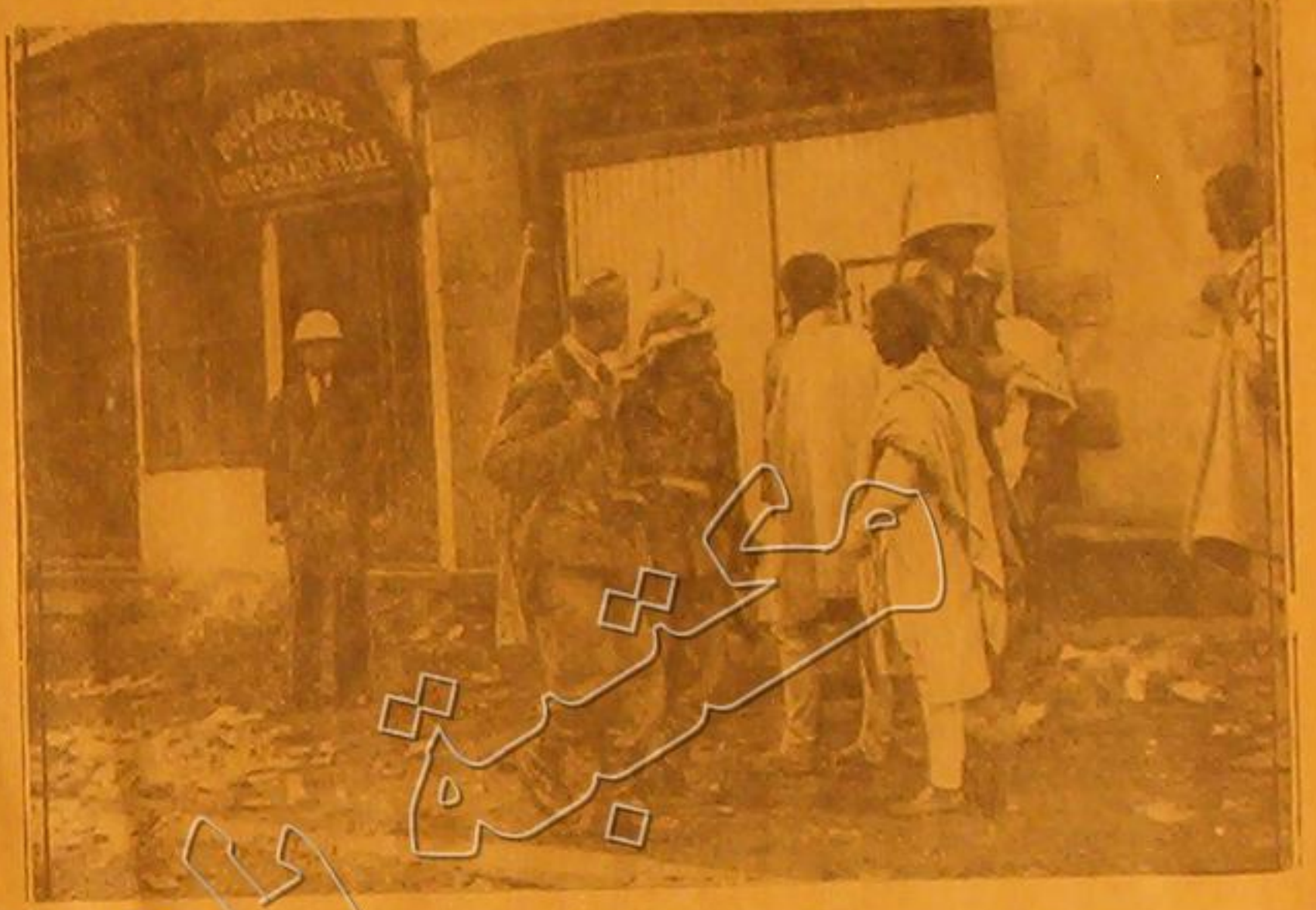
صورة الجورد الايطاليين في شوارع اديس ابابا يستشون على الشوارع بالاصوم من افراد الشعب ويحافظون على النظام