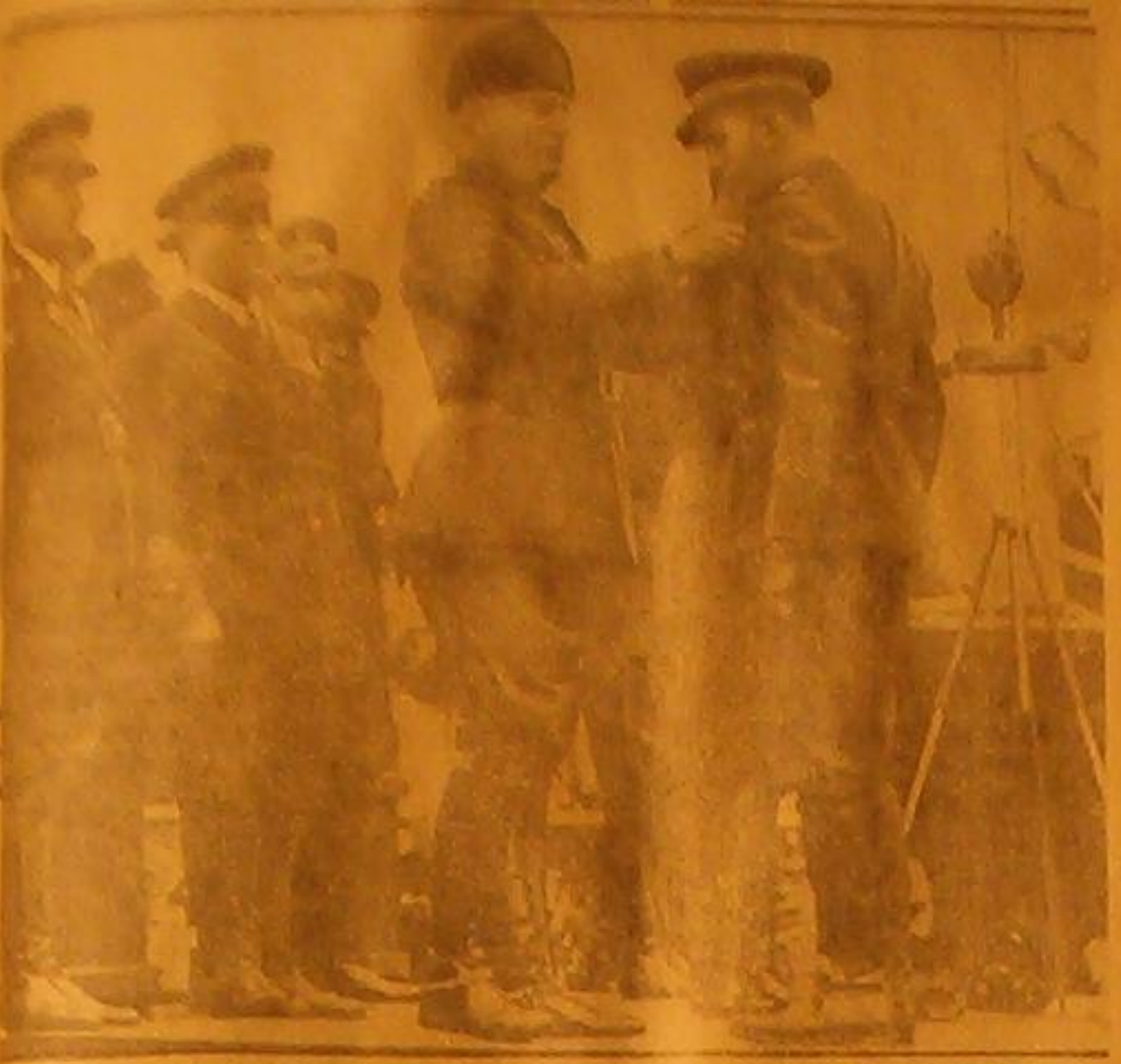
السير موسوليني يطلق على صدر ابنه البكر « برونو » وساماً بمناسبة انتصار القوات الجوية على الحبشة