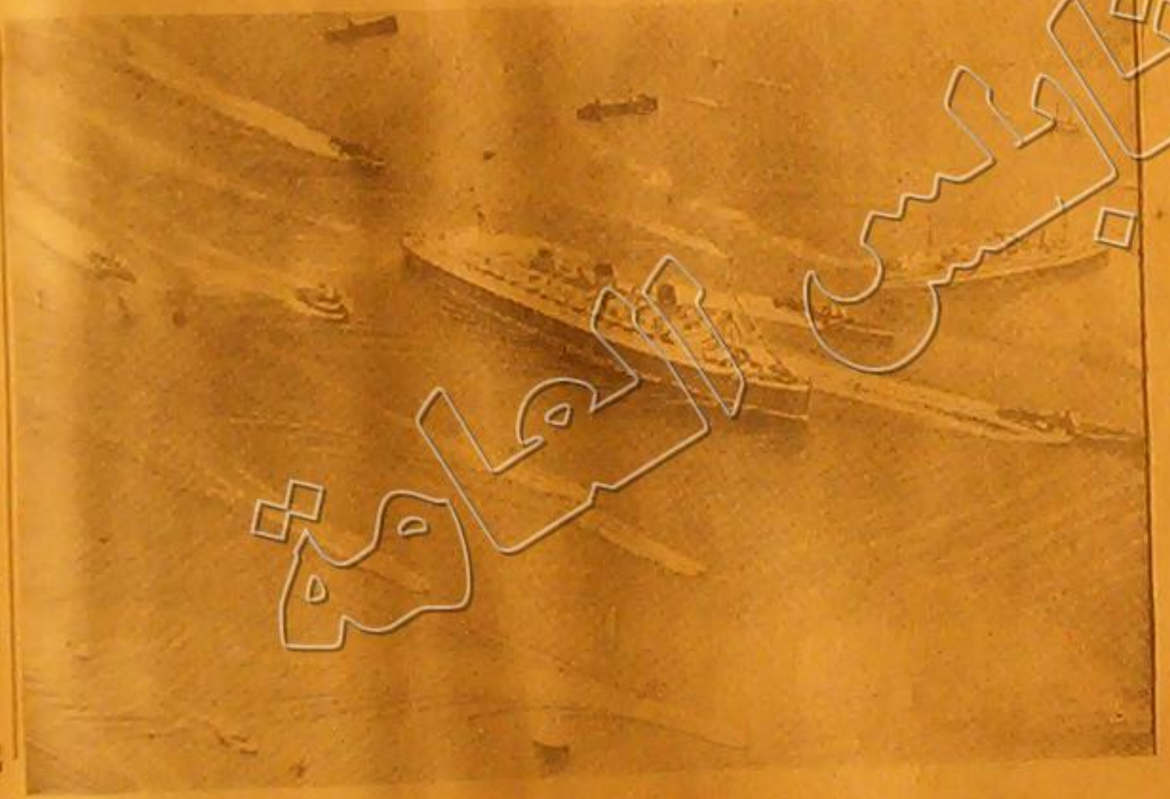
صورة الباخرة الانكليزية « كوين ماري » في اولى سفراتها الى نيويورك وقد تبعها عند تحركها كثير من الزوارق البخارية