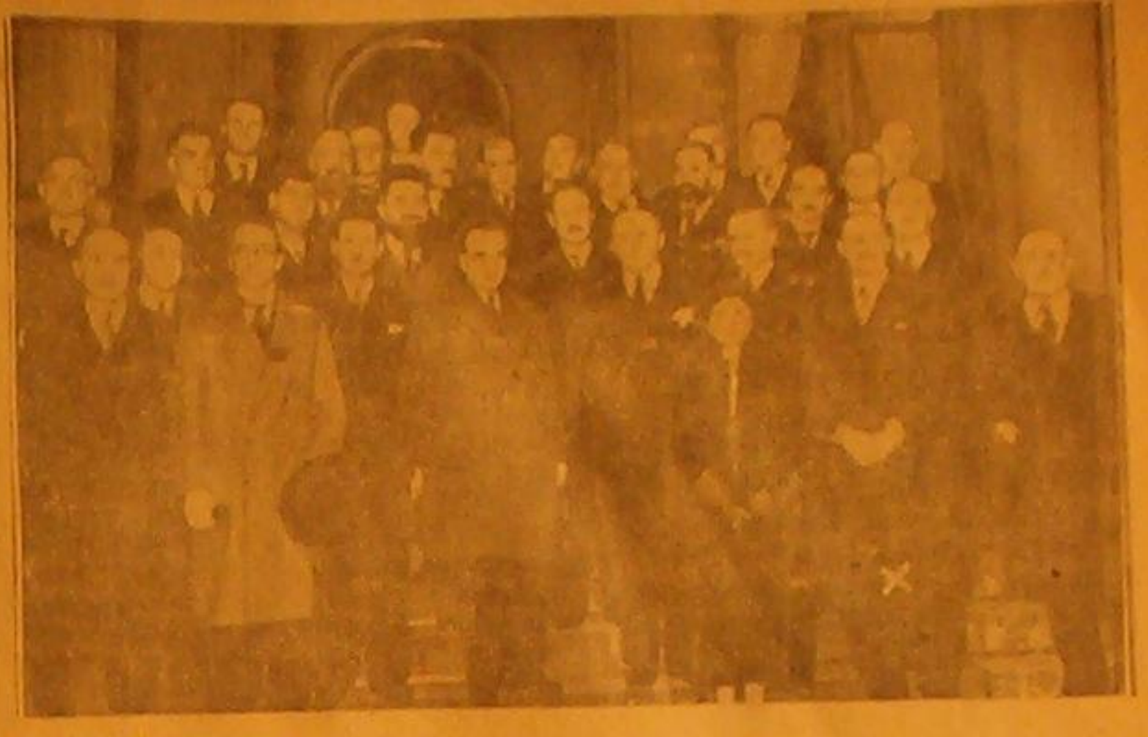
رئيس الوزارة الافرنسية الجديدة لسيو ليون بلوم وقد اشير اليه بعلامة (X) وقد أخذت له هذه الصورة مع اعضاء وزارته