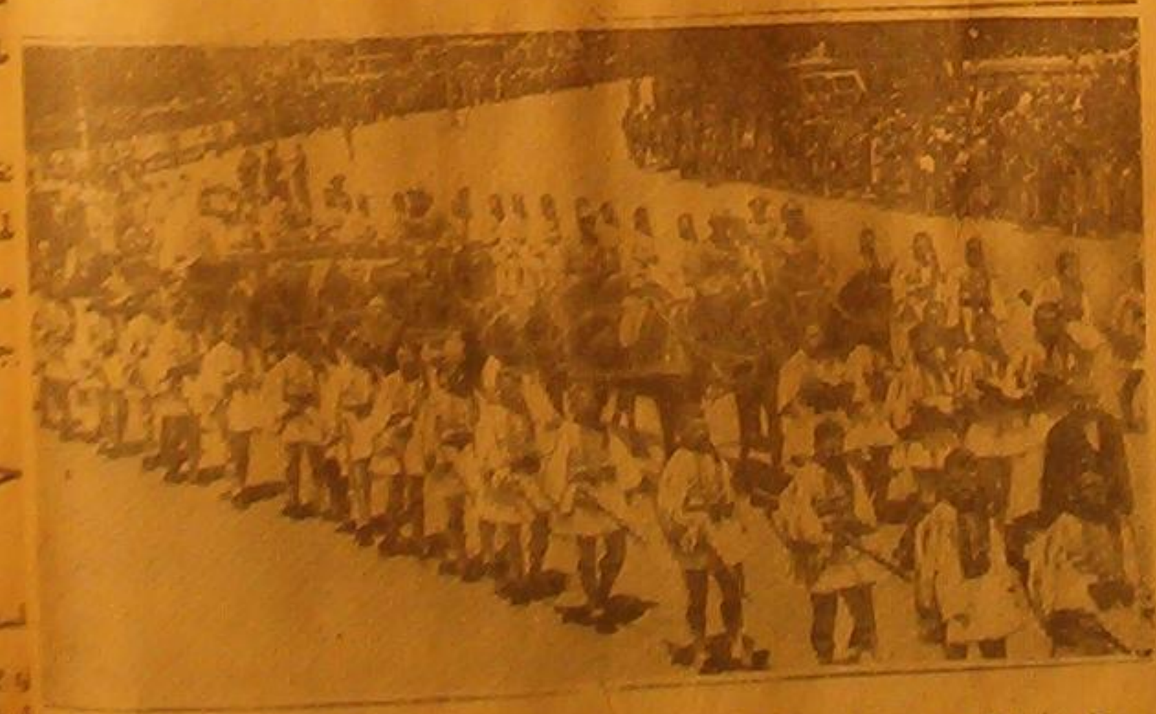
صورة جنازة المرحوم تسالدار بس رئيس الوزارة البونابرية سابقا الذي توفي في اثينا مؤخرًا واشترك الجيش